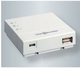
Vitoconnect 100 mit Anschlüssen für das Steckernetzteil (links) und zur Datenverbindung